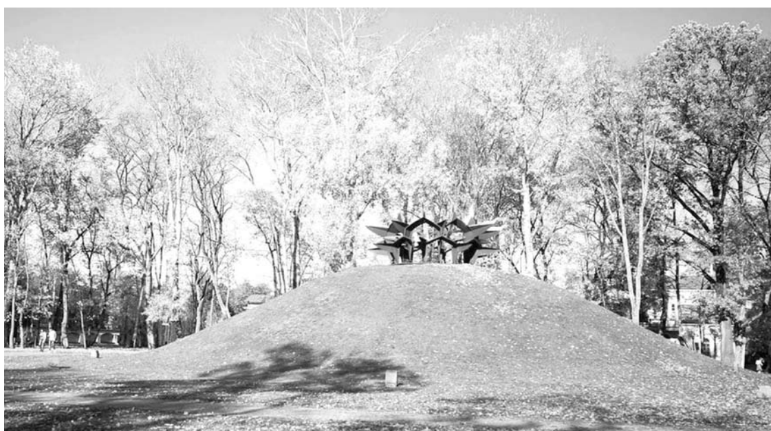
Tuskulėnų rimties parko centre – dirbtinė kalva, ant kurios pastatyta skulptūra, skirta atminti čia palaidotiems žmonėms.