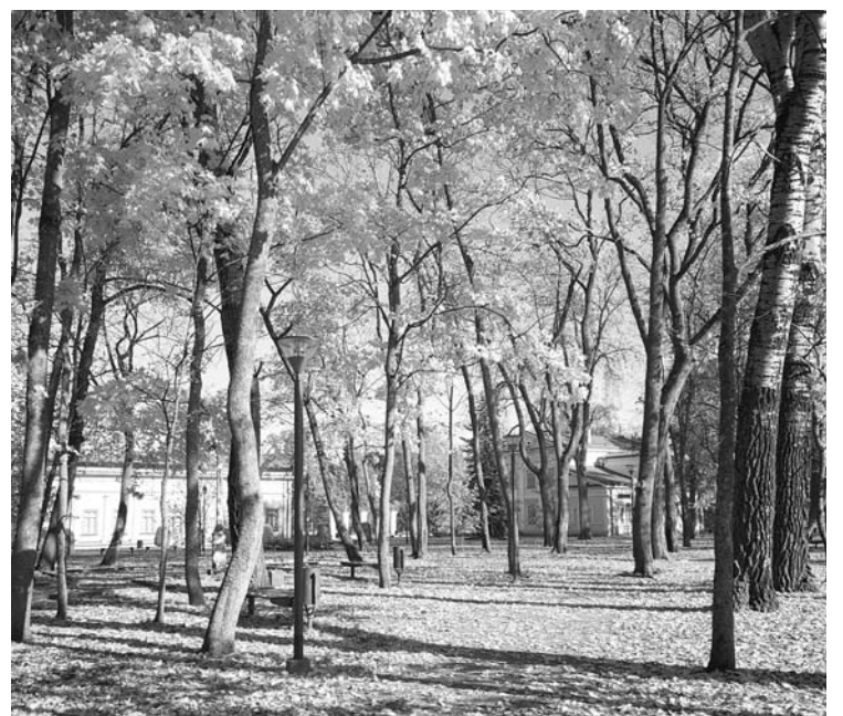
Tuskulėnų rimties parkas, dabar pilnas gyvybės, ilgai slėpė palaidojimus.