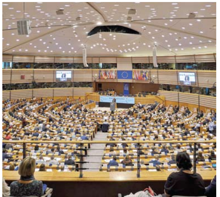
Europos Parlamento posėdžių salė - čia priimami svarbiausi Europos Sąjungai sprendimai.

Apie Vokietijos miestus ir Briuselį - kituose „Anykštos“ numeruose.