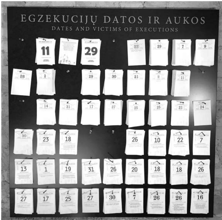
Kalendoriaus lapeliai, kuriuose simboliškai sudėliotos mirusiųjų pavardės.