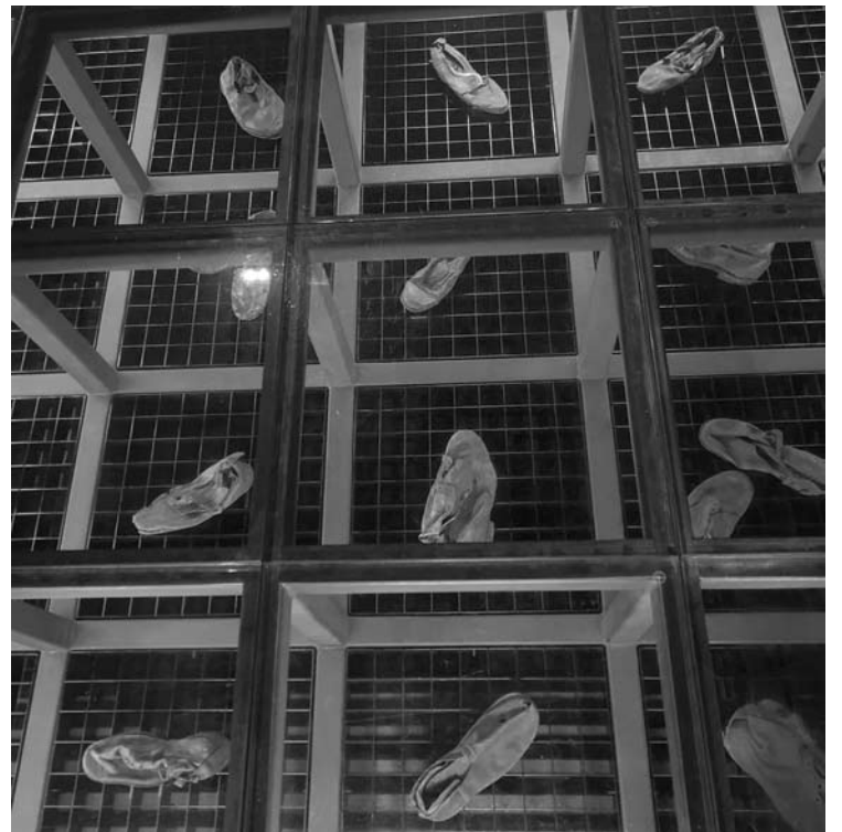
Aukų batai, sumesti į atskiras duobes, nes mirusieji dažniausiai buvo laidojami nuogi arba tik su apatiniais rūbais.