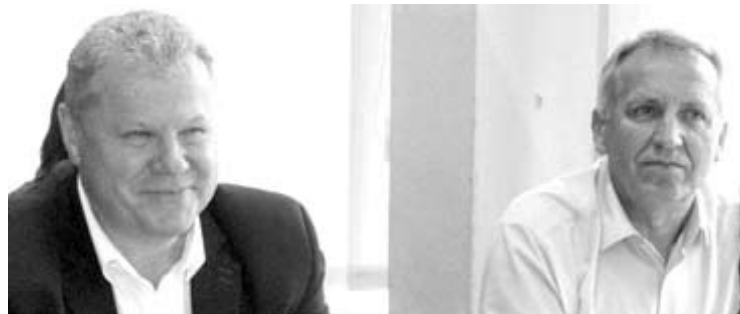
Seimo narys Antanas Baura (dešinėje) ir Anyškčių rajono meras Kęstutis Tubis kaip reikiant susikibo dėl Vyriausybės nutarimo įsigaliojimo datos.

Anyškčių rajono meras Kęstutis Tubis įsivėlė į keistą ginčą su Seimo nariu Antanu Baura.