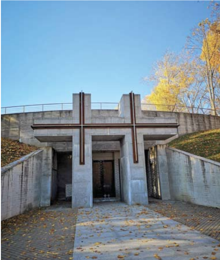
Koplyčia – kolumbariumas Tuskulėnų rimties parke.

Šią šurpią istoriją pasakoja Tuskulėnų rimties parko memorialinis kompleksas.