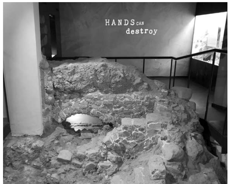
XVI a. keramikos degimo krosnis, kurią rado Baltojo dvarelio rūsyje.